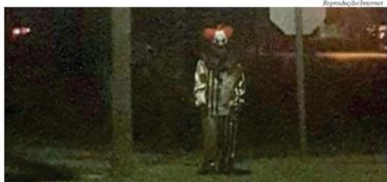
Imagem que está sendo compartilhada entre os moradores

Neste fim de semana, um dos assuntos mais comentados na internet entre os moradores de Catalão, são as supostas aparições de "palhaços assassinos" nas ruas da cidade.