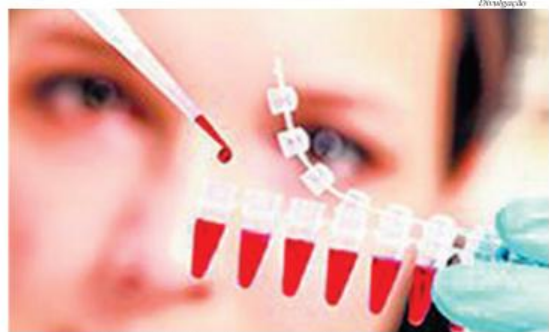
Três entidades médicas se posicionaram a favor da não obrigatoriedade do jejum

O exame que calcula o nível de gordura no sangue e que exige jejum de 12 horas para um diagnóstico preciso foi analisado por três entidades médicas brasileiras: a Sociedade Brasileira de Cardiologia, a de Patologia Clínica e Medicina Laboratorial e Análises Clínicas. As três declararam oficialmente que não será necessário o paciente fazer jejum para o exame.