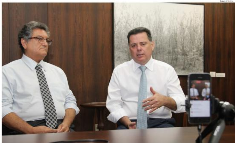
Em hangout, junto com o superintendente de Cultura, Nasr Chaul, governador afirmou que os centros serão instalados nas maiores 20 cidades goianas

O governador Marconi Perillo anunciou, no dia 11, a criação de 20 centros culturais nas 20 maiores cidades goianas. O anúncio foi feito durante o programa Papo Com Governador, bate-papo em tempo real com internautas por meio do Facebook. Acompanhado pelo superintendente de Cultura da Seduce, Nasr Chaul, ele informou que as cidades que abriga-