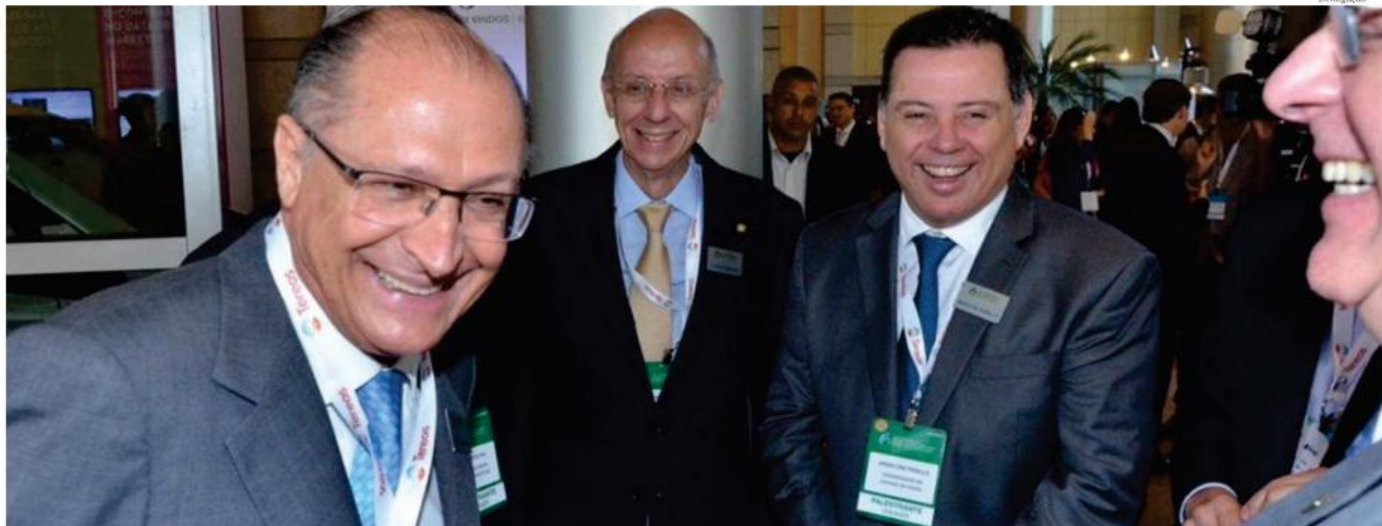
Além de Marconi, os governadores Geraldo Alckmin (São Paulo) e Renan Filho (Alagoas) também participam do painel.

O governador Marconi Perillo lançou nesta segunda-feira, na abertura da 16.ª Conferência Internacional Datrago sobre Açúcar e Etanol, em São Paulo, a proposta da taxa dos combustíveis fósseis, por agressão ao meio ambiente e danos à saúde humana. Marconi, que ao lado do governador de São Paulo, Geraldo Alckmin, ministrou palestra no painel Etanol e Desenvolvimento Econômico, disse que fará gestões como agente político para que a Organização Municipal de Saúde (OMS) desenvolva uma política, nos casos dos combustíveis poluentes, semelhante ao que desenvolve hoje em relação ao tabaco.