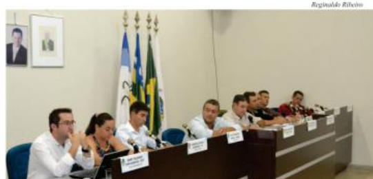
Composição da mesa diretora

Executivo Municipal. O 236/-2016 que encaminha a Lei 05/-2016 que “Institui o sistema municipal de desenvolvimento sustentável da piscicultura, e dá outras providências”; e a Lei 06/-2016 que “Denomina prédio público de Orlando da Silva e dá outras providências”. E o 239/-2016 que convidava para comemoração do dia da criança.