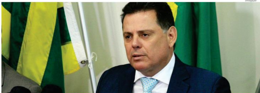
“É melhor ter uma PEC que limita gastos, do que dar aumentos e mais aumentos, gastar o que não se tem”, disse o governador Marconi Perillo

Sobre a “PEC dos Gastos”, ele argumentou que vai, na prática, “limitar a gastança”, porque o Estado não pode gastar mais do que arrecada, sob pena de acontecer com os outros estados o que já está acontecendo com o Rio de Janeiro, que acabou de pedir ao governo federal R$ 14 bilhões. “O que está acontecendo é que os aposentados não estão recebendo em dia, já não há mais dinheiro para comprar remédios, gasolina para as viaturas policiais”, ponderou o governador, acrescentando que o problema é sério porque não é só o Rio de Janeiro que está passando por essa situação, mas outros 20 Estados já estão anunciando que não têm dinheiro para pagar o funcionalismo público, que não é o caso de Goiás.