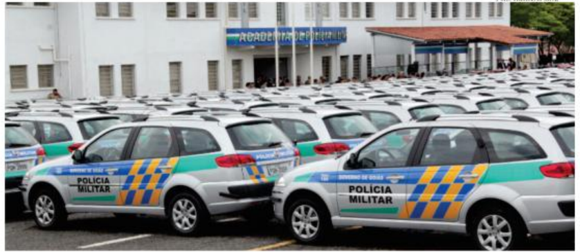
Durante entrega de viaturas, Marconi confirma reajuste para servidores da Segurança

Marconi lembrou, também, que os salários das polícias passavam por constantes atrasos de até cinco meses, além de serem ínfimos. “Hoje, parece que essa realidade está muito distante, mas não está não. Ela está na memória de muitos de nós que presenciamos essas cenas ao longo dos tempos passados. Hoje é comum a todos falarem de Segurança Pública, mas quando tiveram ou têm a oportuni-