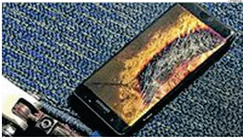
Empresa pode retirar definitivamente Galaxy Note 7 do mercado

Quando o número de pré-vendas do novo Samsung Galaxy Note 7 ultrapassou o número de aparelhos disponíveis em loja, a maior fabricante de celulares do mundo estava longe de imaginar que esse seria o menor dos seus problemas e um novo capítulo da tecnologia: a era dos celulares definitivamente explosivos.