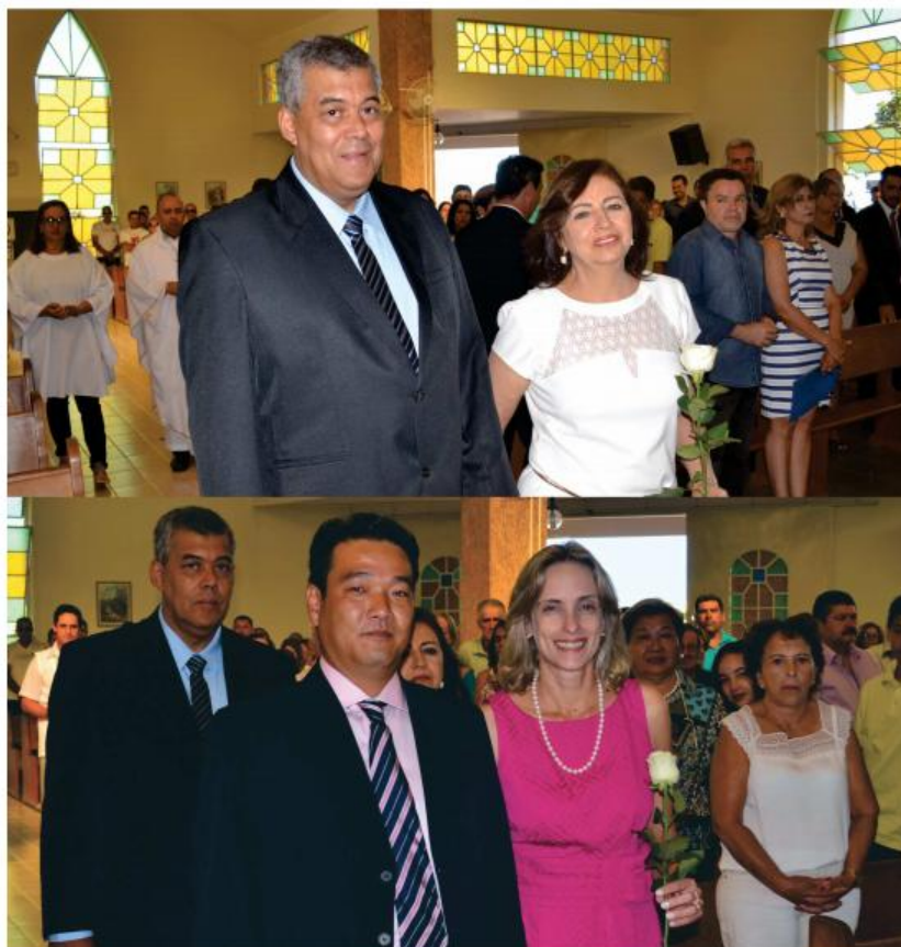
Acompanhados por familiares, amigos e correligionários, prefeito e vice-prefeito são empossados após cerimônia religiosa.