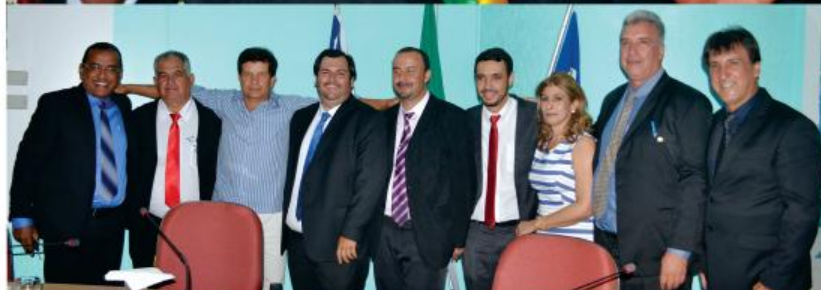
Prefeito e vereadores eleitos em Campo Alegre são empossados para um mandato de quatro anos.

“Queremos tirar Campo Alegre do atraso e proporcionar o desenvolvimento do nosso município, com o sentimento de que juntos nós podemos fazer mais e melhor”, disse o novo prefeito, que também agradeceu