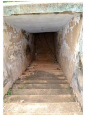
Túnel de acesso ao campo de futebol, destruído

"Caso seja necessário, vamos sim abrir processo para que seja investigada a responsabilidade pelas irregularidades que estamos encontrando e para que os responsáveis arquem com os prejuízos, uma vez que são bens comprados com o dinheiro público e a população campoalegrense merece saber o que aconteceu com eles", ressaltou o prefeito.