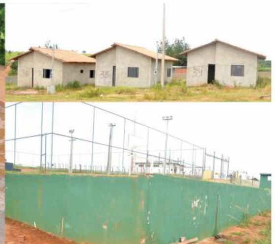
Rua esburacada, Conjunto de casas sem acabe e Quadra de Esporte abandonada