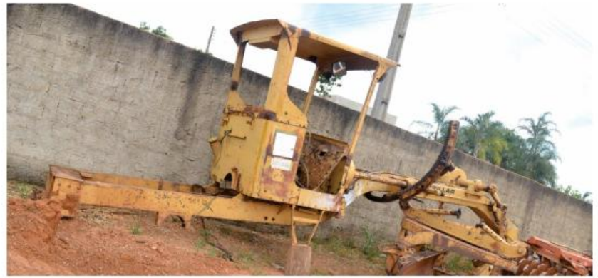
Motoniveladora totalmente sem condições de uso, as peças da máquina sumiram

A expectativa de que receberiam muitos problemas como herança da administração passada, se confirmou já no recebimento dos maquinários da prefeitura. Veículos como caminhões, tratores, ônibus escolares e demais carros das secretarias,